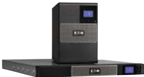
Disponible en format Tour et Rack 1U