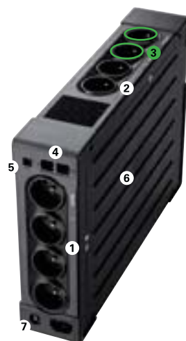
Eaton Ellipse PRO 1200/1600