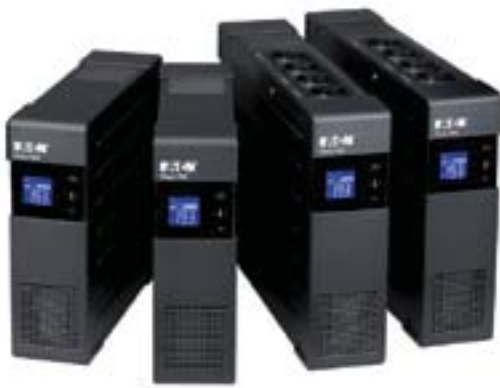
Gamme Ellipse PRO