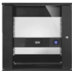
Format faible profondeur pour intégration facile dans de petites armoires