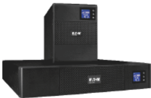
Disponible en format compact