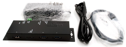
EX-K1110 - DC-Jack ~ Terminal Block